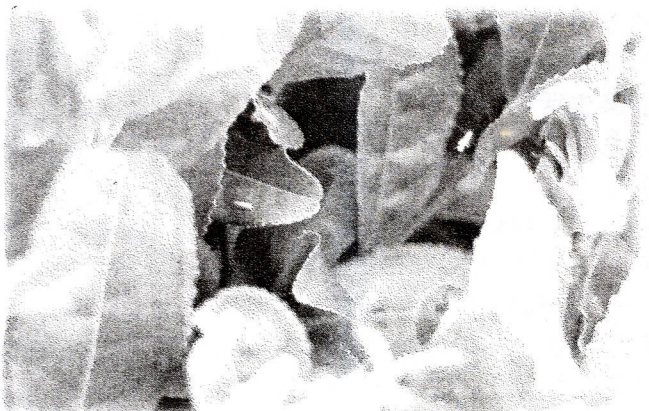
↓ウンカ(右は蜘蛛の巣にかかったウンカ)

ところで、和紅茶ブームではあるけれど、拙園も含めなかなか納得のいく紅茶にお目にかからない。紅茶作りは本当に難しい。特に ①緑茶生産とのバランス、